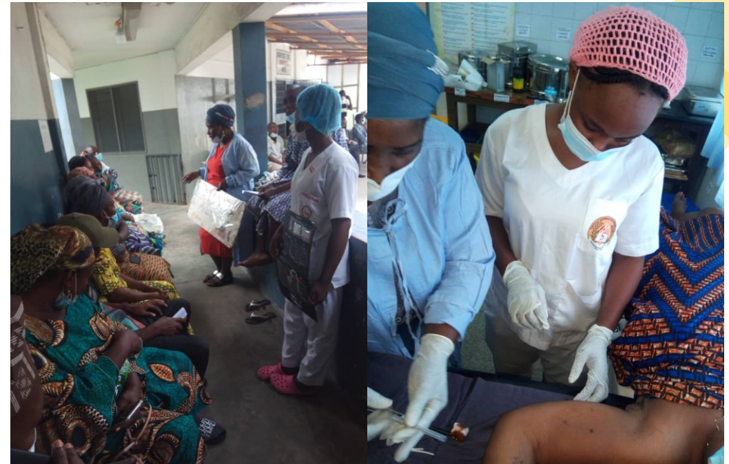
Quelques images des journées spéciales PF organisées dans un PPS de Cotonou (CHU-MEL) en août 2021