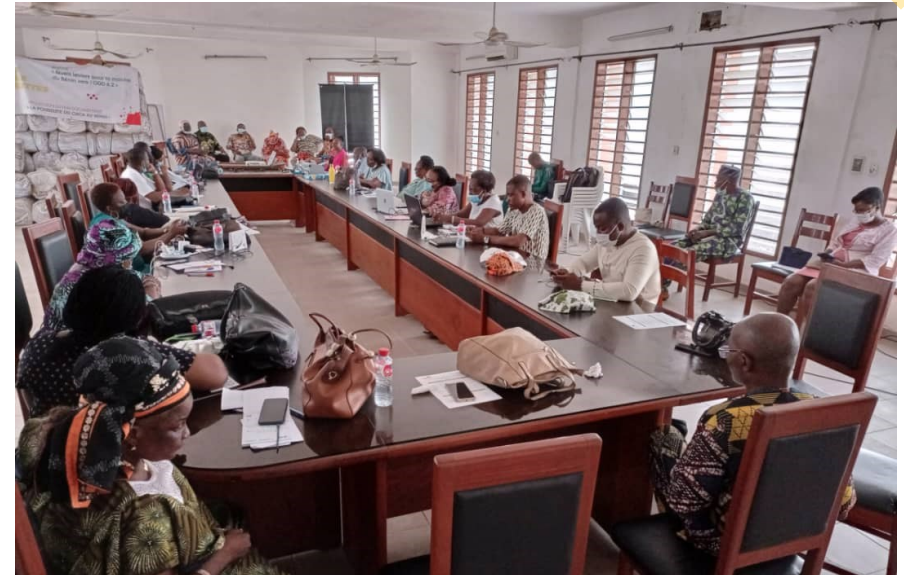
Photo de l'atelier d'orientation du groupe de suivi et de préparation de la mise en œuvre de l'ARC _ 1 er au 2/03/22