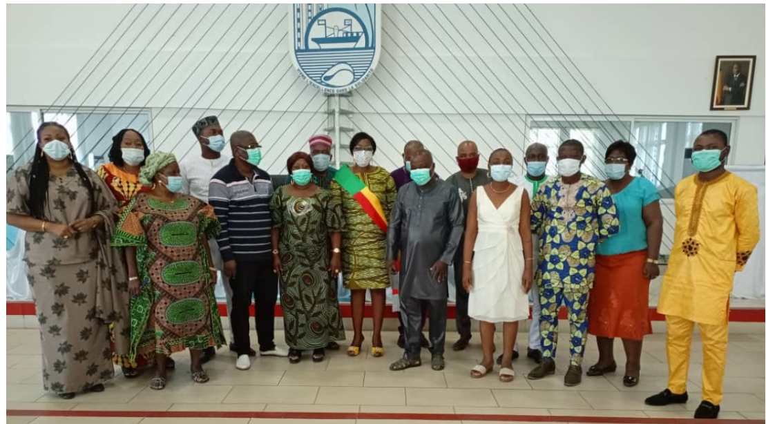
Photo de famille de l'atelier d'orientation des Conseillers municipaux de la Ville de Cotonou sur la PF/SSRAJ _ 29/01/2021