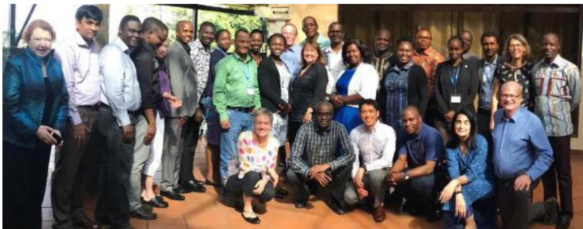
Les membres du comité Planification familiale en milieu urbain, les boursiers et les candidats de l'atelier de sélection de la seconde cohorte – en 2019 à Entebbe.

Le programme de bourses de l'UIESP pour la planification familiale en milieu urbain (2018-2023) s'est achevé le 31 août 2023. Le programme, financé par une subvention de la Fondation Bill et Melinda Gates et mis en œuvre par le Comité de l'UIESP sur la planification familiale, la fécondité et le développement en milieu urbain , a octroyé des bourses de recherche, des formations et un encadrement à des chercheurs en début de carrière en Afrique subsaharienne pour mener des recherches pertinentes pour les politiques sur la planification familiale en milieu urbain et pour s'engager auprès des urbanistes et les décideurs politiques afin de les sensibiliser aux contributions de la planification familiale au développement en milieu urbain. Seize bourses avaient été initialement attribuées et 12 boursiers ont complété leurs recherches dans le cadre du programme de bourses. ( Rencontrez les boursiers )