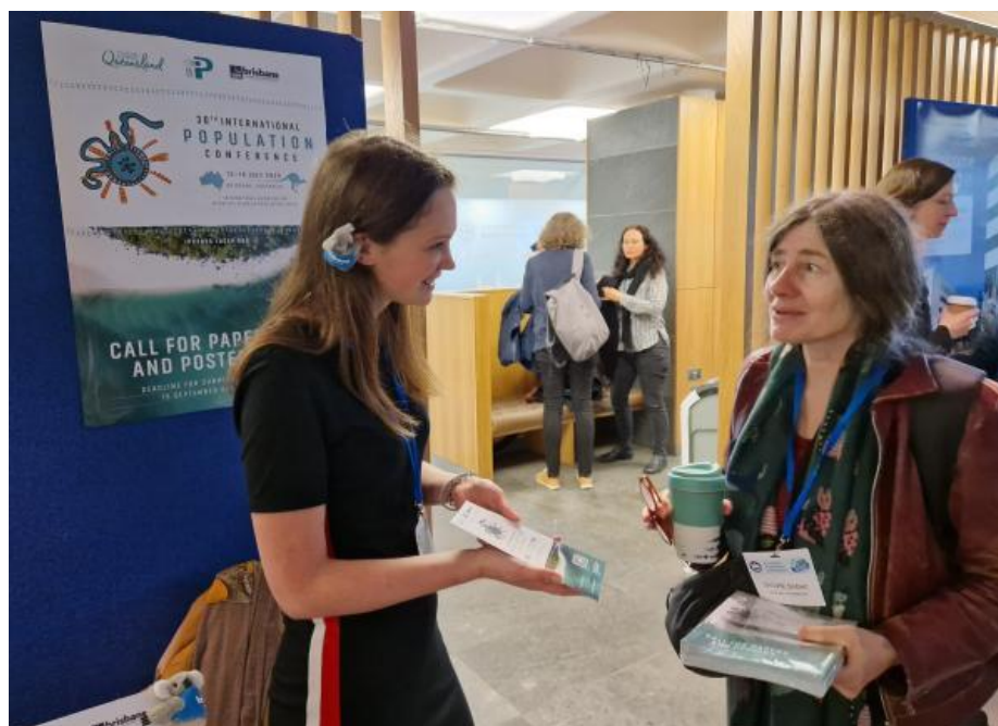
Une membre du réseau des doctorant·es de l'EAPS aidant à promouvoir l'appel à communications pour l'IPC2025 au stand partagé EAPS-UIESP.

L'UIESP disposait également d'un stand pour encourager les participants à rejoindre l'UIESP et à soumettre une proposition de communication pour le prochain Congrès international de la population (IIPC2025) à Brisbane, en Australie.