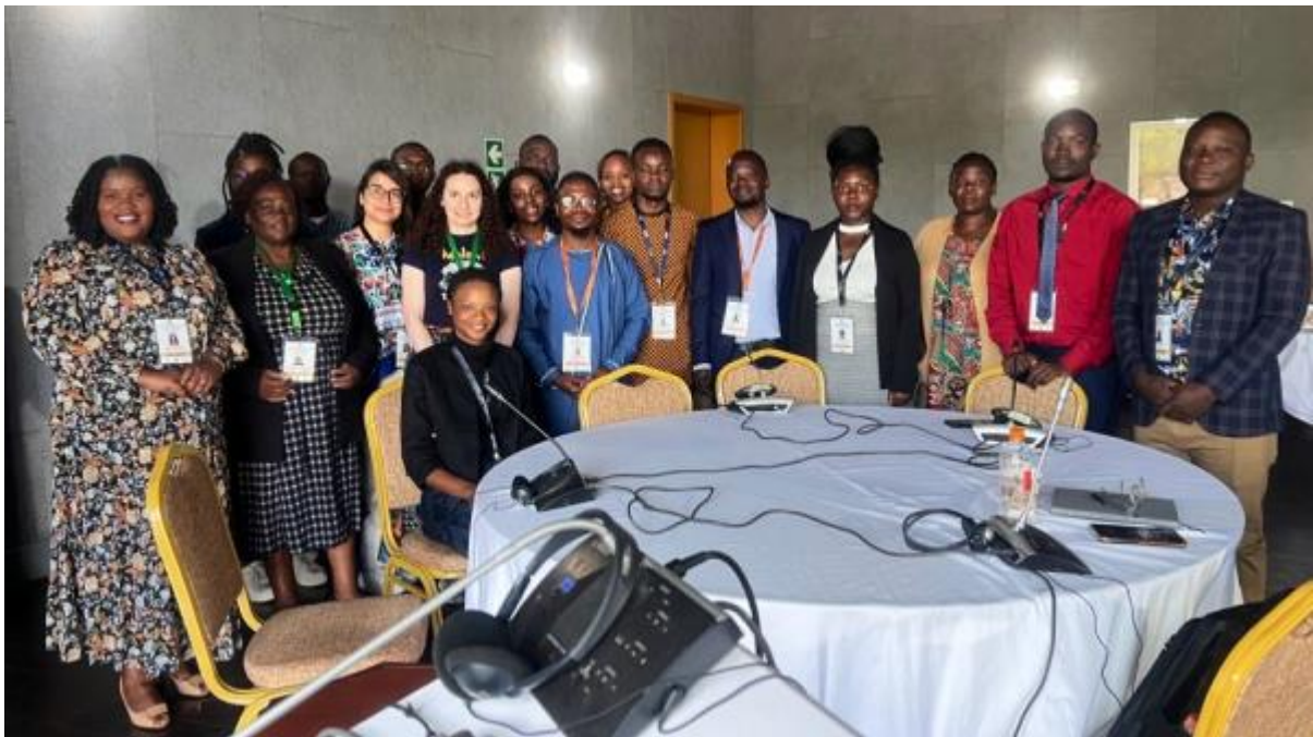
Participants de l'atelier.