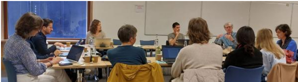
Module 1 - "Processus de relecture ouvert".

domaine des migrations au cours de la vie. L'atelier s'est terminé par une session de réseautage visant à renforcer le réseau de l'UIESP et à préparer le terrain pour de futures collaborations pour combler les lacunes actuelles de la littérature scientifique.