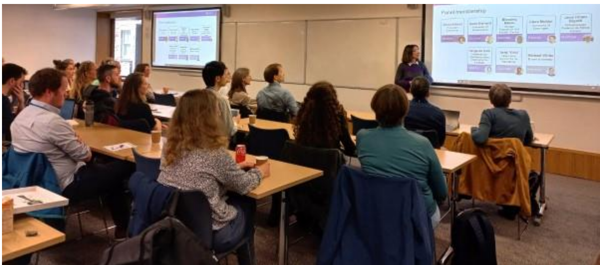
Module 2 - Présentation des projets ERC LIFELONGMOVE, FamilyTies et MYMOVE, et discussion sur les perspectives pour le domaine des migrations au cours de la vie.