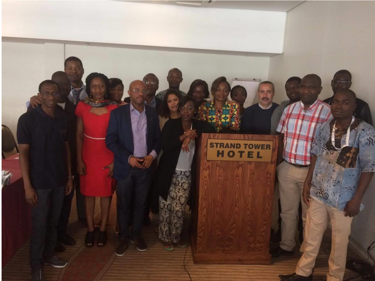
Photo de famille, réseau FraNet

Cape Town, Strand Towel Hotel, 29 Octobre 2017